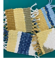
玉ねぎ染のコースター