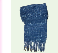
藍染の手織りマフラー